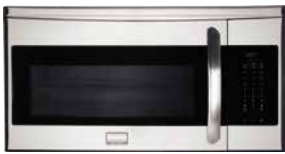
À HOTTE INTÉGRÉE

Côté fours à micro-ondes, de nombreux choix s'offrent à vous. Cette liste de vérification peut vous aider à faire le bon choix. Remplissez-la et apportez-la à votre détaillant Frigidaire le plus proche.